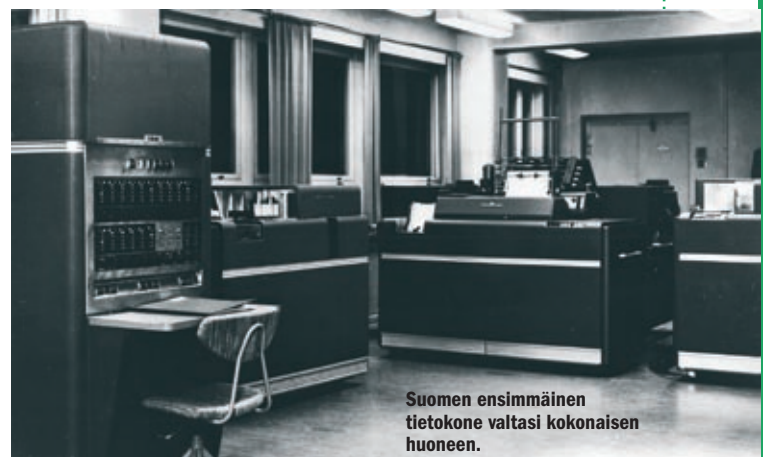
Suomen ensimmäinen tietokone valtasi kokonaisen huoneen.

IBM 650:n sydän oli 2 000 sanaa käsittänyt magneettirumpumuisti, joka pyöri 12 500 kierrosta minuutissa. Laitteisto koostui keskusyksiköstä ja voimayksiköstä, jotka toimivat radioputkilla ja painoivat kumpikin noin tonnin. Lisäksi tarvittiin kaksi taulukointikonetta ja reikäkorttien luku- ja lävistysyksiköt, jotka oli yhdistetty käsivarren paksuisilla kaapeleilla tie-